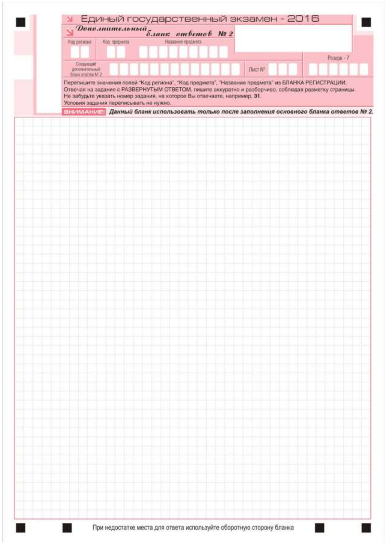
Рис. 11. Дополнительный бланк ответов № 2