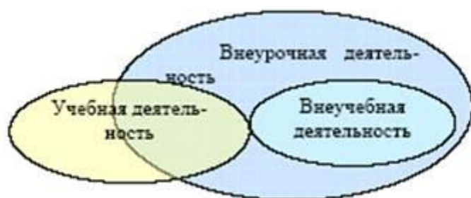
Схема 2. Взаимосвязь неурочной, учебной и внеучебной деятельности школьников

Рассмотрим взаимосвязь внеурочной и внеучебной деятельности школьников. Представим взаимосвязь внеурочной, учебной и внеучебной деятельности школьников в виде множеств (см. схему 2).