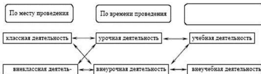
Схема 1. Взаимосвязь различных видов деятельности школьников

Рассмотрим взаимосвязь классификаций по месту и по времени проведения деятельности школьников.